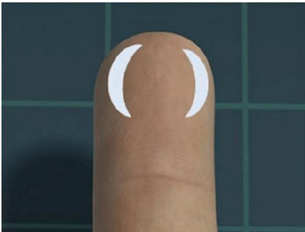
Рисунок 2 - Рекомендуемая область пункции кожи у взрослых и детей старшего возраста